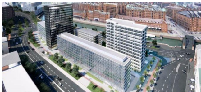
ADINA Hotel Speicherstadt Hamburg

Das Seminar ist praxisorientiert. Anhand konkreter Praxisfälle werden verschiedene Beispiele des Vorgehens dargestellt und diskutiert