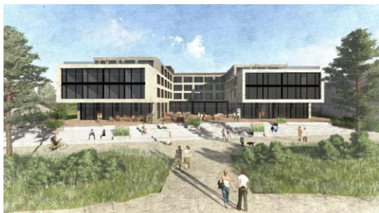
neues Hotel Urban nature St. Peter Ording

Die Pandemie hat gezeigt, wie schnell arbeits-rechtliche Regelungen neu entstehen bzw. geändert werden. Auch hat sich die Arbeitswelt durch Home office grundlegend geändert. Betriebsräte müssen sich dadurch auch verstärkt mit Modellen des desk sharing auseinandersetzen. Wir wollen in dem Seminar (abhängig von der Corona-Lage) die aktuelle Gesetzeslage analysieren und praktische Handlungstipps diskutieren. Daneben gibt es zahlreiche neue gesetzliche Regelungen im Arbeitsrecht zu beachten.