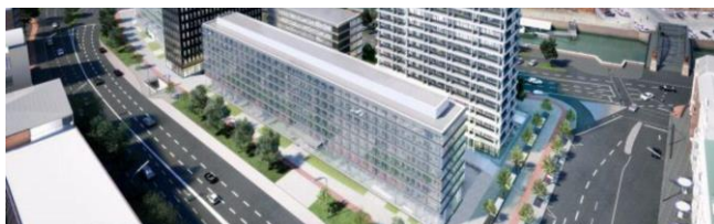
ADINA Hotel Speicherstadt Hamburg